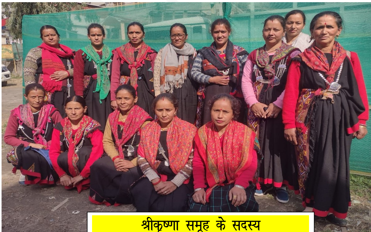
श्रीकृष्णा समूह के सदस्य